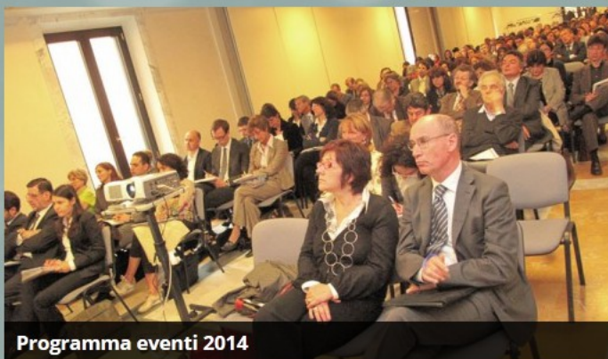
Programma eventi 2014